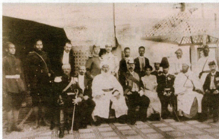
Expédition du comte von Tattenbach Fès 1905.