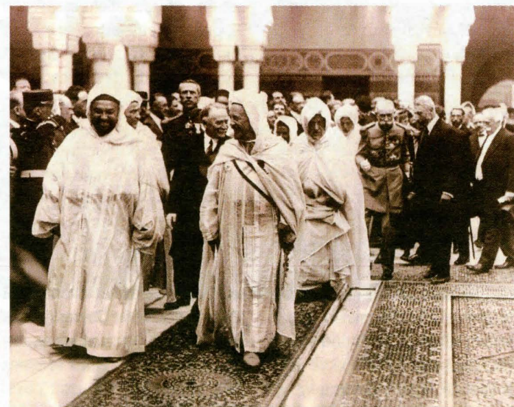
Le Sultan Moulay Youssef à l'ouverture de la mosquée de Paris Le 2 août 1926.

des réalités de l'émigration et en modifiant la perception. L'exposition éveille enfin les consciences à une identité marocaine qui, ouverte sur le monde, n'en préserve pas moins une spécificité qui s'exprime dans les productions des artistes marocains contemporains ainsi que dans un savoir-faire reconnu tant dans les domaines commerciaux que culturels. Le parcours de l'exposition en sept modules distincts met en évidence l'importance de l'imaginaire tant dans la tête des Européens entrés en contact