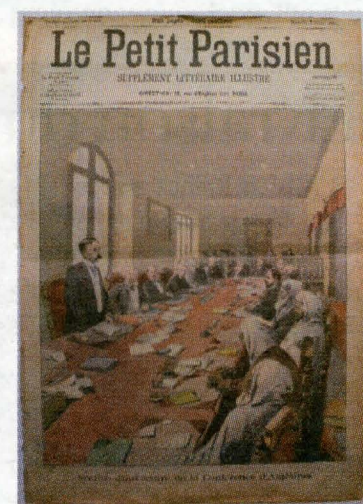
Séance d'ouverture de la conférence d'Algésiras Le Petit Parisien du 4 février 1906.