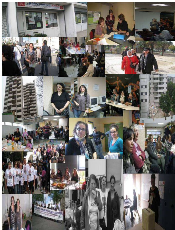
L'espace femmes citoyennes de l'ATMF

UMR CRESPPA-GTM-CNRS 59-61 rue Pouchet 75849 Paris cEDEX17 http://www.gtm.cnrs.fr