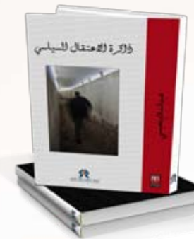
Mémoire de la détention politique Abdeslam Benaissi. Arabe