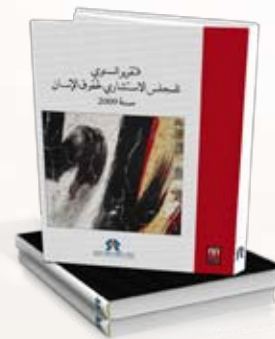
Rapport annuel du Conseil consultatif des droits de l'Homme 2009