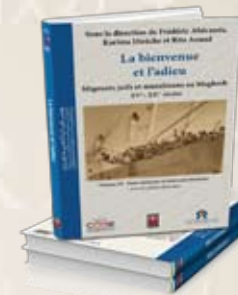
La bienvenue et l'adieu Volume III : Entre mémoire et nouveaux horizons