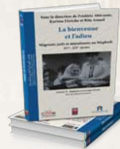
La bienvenue et l'adieu Volume II : Ruptures et recompositions