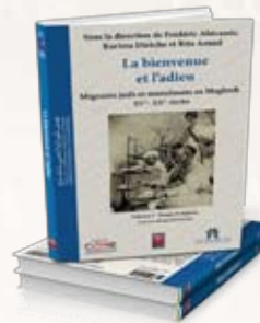
La bienvenue et l'adieu Volume I : Temps et espaces