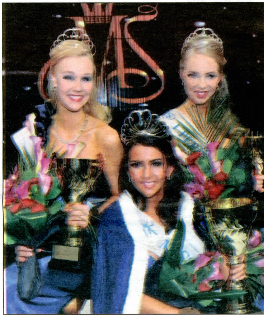
ملكة جمال فنلندا سارة شفاق