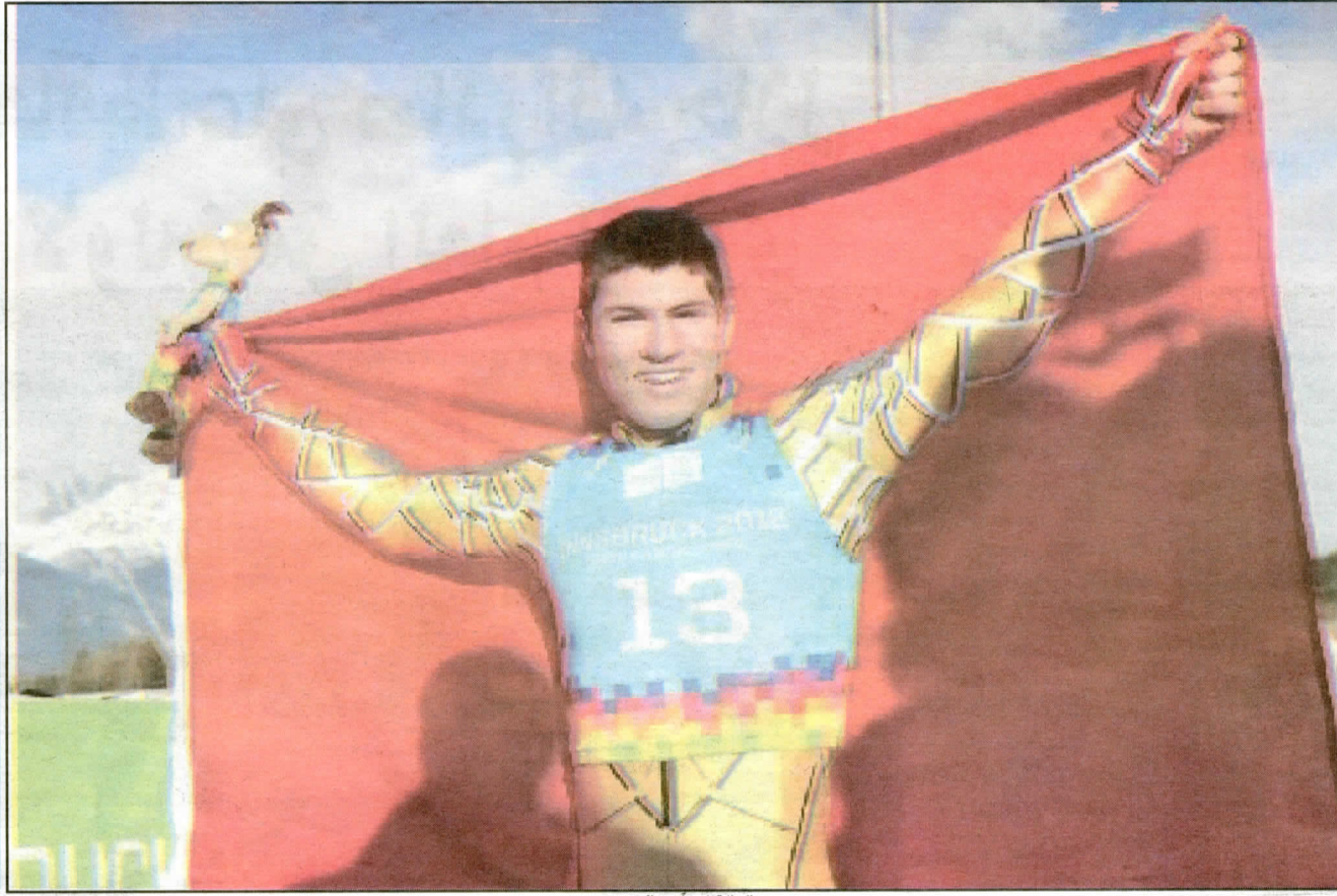
بطل التزلج آدم-المحمدي