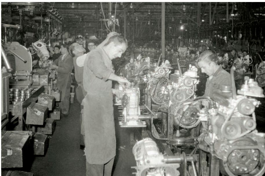
L'usine Renault de Boulogne-Billancourt dans les années 1960.

L'ATRIS, fondée en 1998, se veut également porteuse d'un message aux générations futures. Munis de portraits (œuvres entre autres de Gérald Bloncourt et Yann Murry-Robin) et de témoignages des anciens travailleurs de Renault (retranscrits notamment dans Retour sur l'Île Seguin , film de Mehdi Lallaoui sorti en 2003) et de clichés historiques de l'usine de l'Île Seguin, les adhérents d'Artis sillonnent les collèges et les lycées de France pour « dire à nos enfants, à qui d'aucuns continuent de rappeler qu'ils ne sont pas des Français de souche, sont des